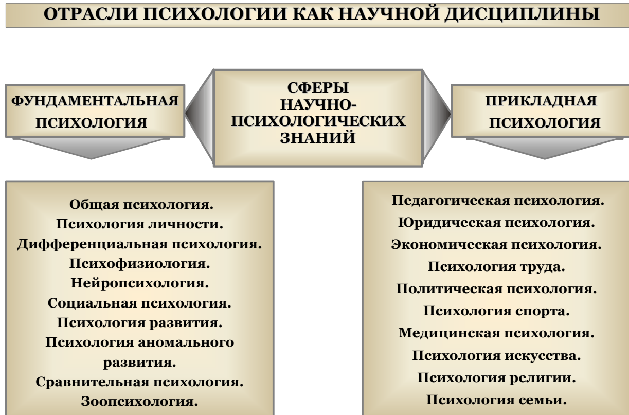
Рис. 2. Отрасли психологии как научной дисциплины.