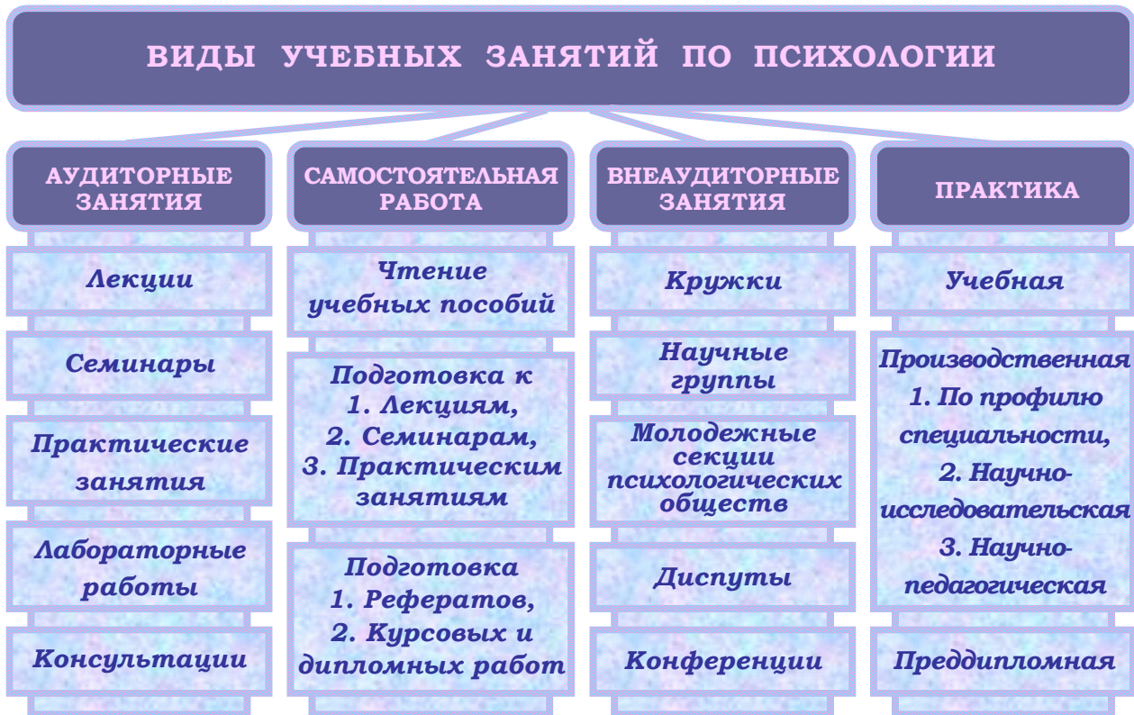
Рис. 3. Виды учебных занятий по психологии.