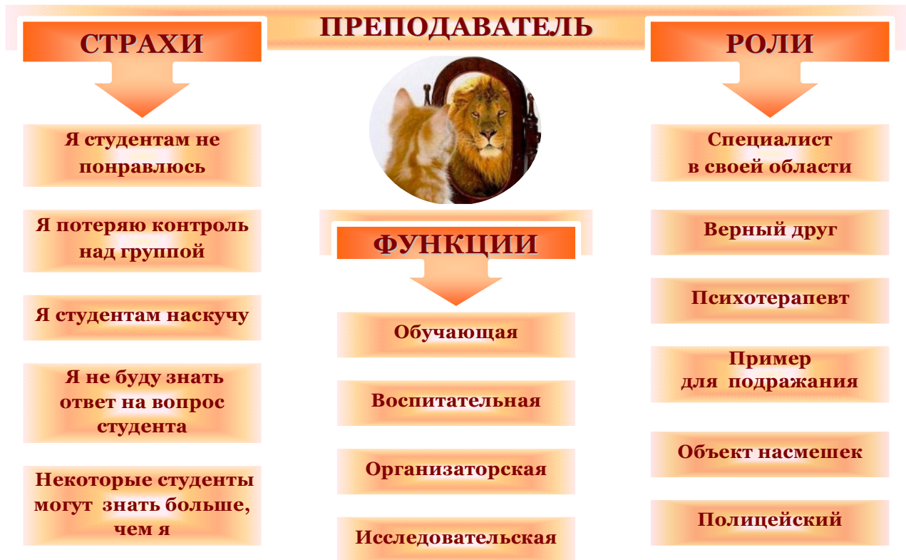
Рис. 5. Функции преподавателя психологии и его роли, а также страхи молодых педагогов.