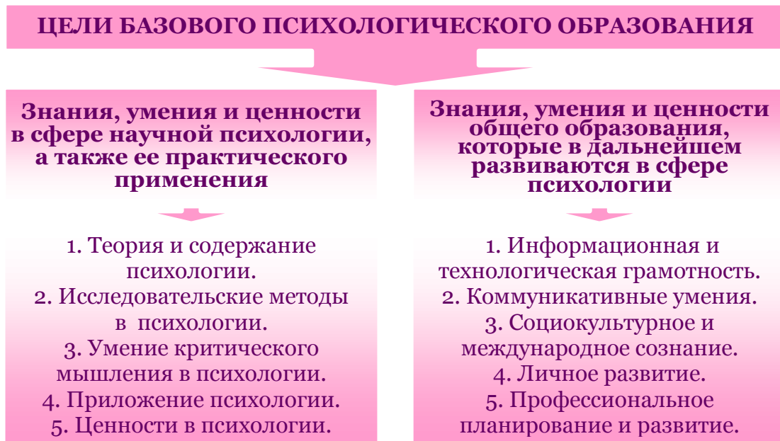
Рис. 1. Цели преподавания психологии (по материалам доклада «Базовое психологическое образование: цели и результаты»).